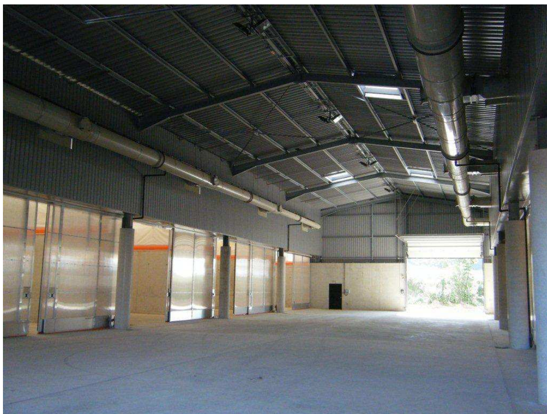
Photo 15 : vue des cellules de compostage lors de la visite d'inauguration de Kérambris du 6 juillet 2013.

DEVENEZ SENTINELLE ENVIRONNEMENTALE , pour nous signaler une pollution, un problème particulier, lié à la protection de l'environnement : www.aspfasso.fr