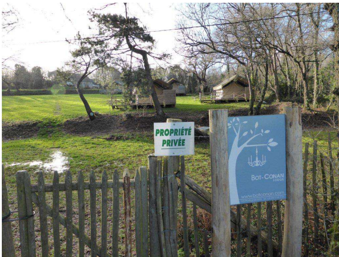
Photo 05 : une des photos présentées par l'ASPF au Tribunal Administratif de Rennes le 13 décembre 2013, rien n'est démonté en hiver comme prévu hors saison.