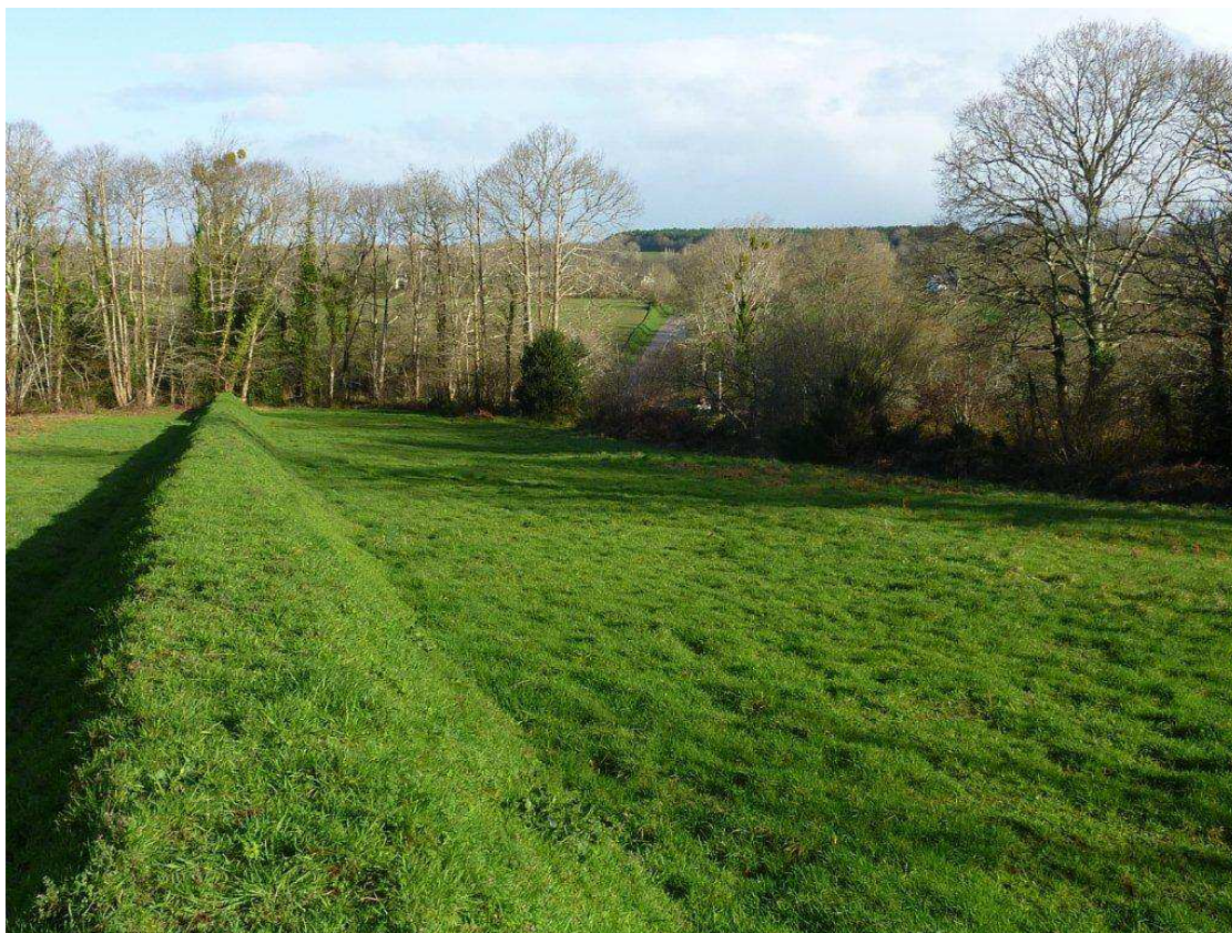
Photo 08 : vue de la parcelle – On distingue, à travers les arbres, la route montant vers Saint-Evarzec.

Afin de lutter contre l'étalement urbain, l'imperméabilisation du terrain et l'extension d'urbanisation, l'ASPF a donc produit un recours gracieux auprès du Maire, signalant l'illégalité de son arrêté. Sans réponse de sa part, l'ASPF a saisi le Tribunal Administratif de Rennes pour en obtenir l'annulation le 30 septembre 2011.