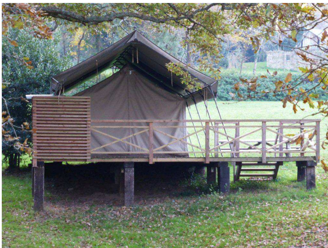
Photo 06 : « des plateformes de plain-pied démontables, des tentes normales ... » qu'ils écrivaient !

Par courrier du 22 septembre 2010, le Secrétaire Général de la Préfecture par le biais du contrôle de légalité alertait le maire sur l'incompatibilité du projet au regard de cette même Loi Littoral :