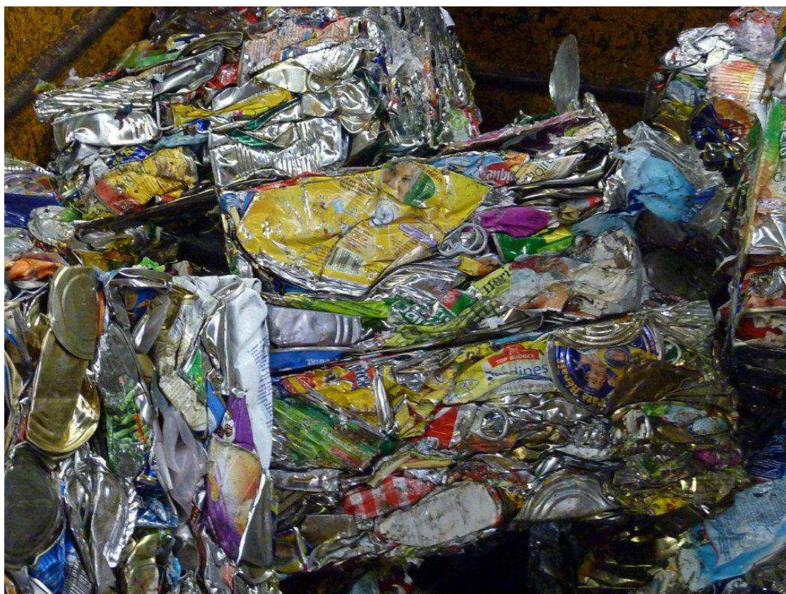
Photo 11 : ... et le « César » de la pollution du ruisseau de Kérambris est attribué à...