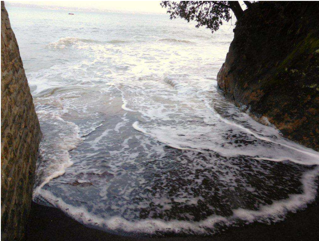
Photo 03 : 2 janvier 2014 - Les aménagements réalisés en 2013 sur la Plage des Oiseaux pour « assurer la continuité du cheminement piétonnier » sont bien entendu totalement submergés par la grande marée. Le flot remonte même dans le chemin des oiseaux, interdisant tout accès.

l'assainissement », l'ont été en fait surtout pour éviter le passage de la servitude sur 2 propriétés privées, de part et d'autre du chemin des Oiseaux.