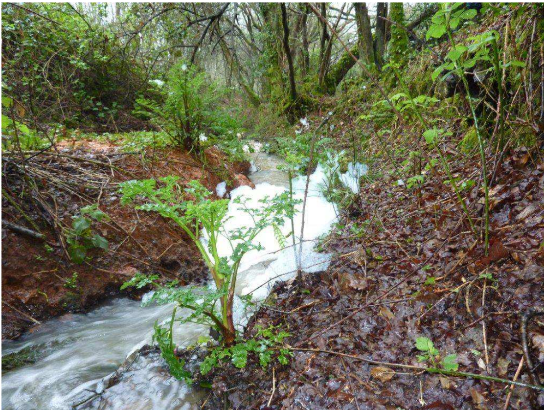
Photo 10 : Le ruisseau « mousseux » de Kérambris dévale vers le captage de Penalenn, pour l'alimentation en « eau potable » de la population fousnantaïse !