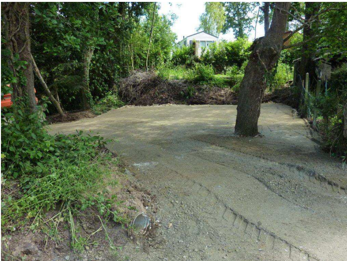
Photo 13 : Zone humide remblayée pour vendre, accéder et construire sur un terrain inaccessible dans la descente de Bellevue à Foesnant.