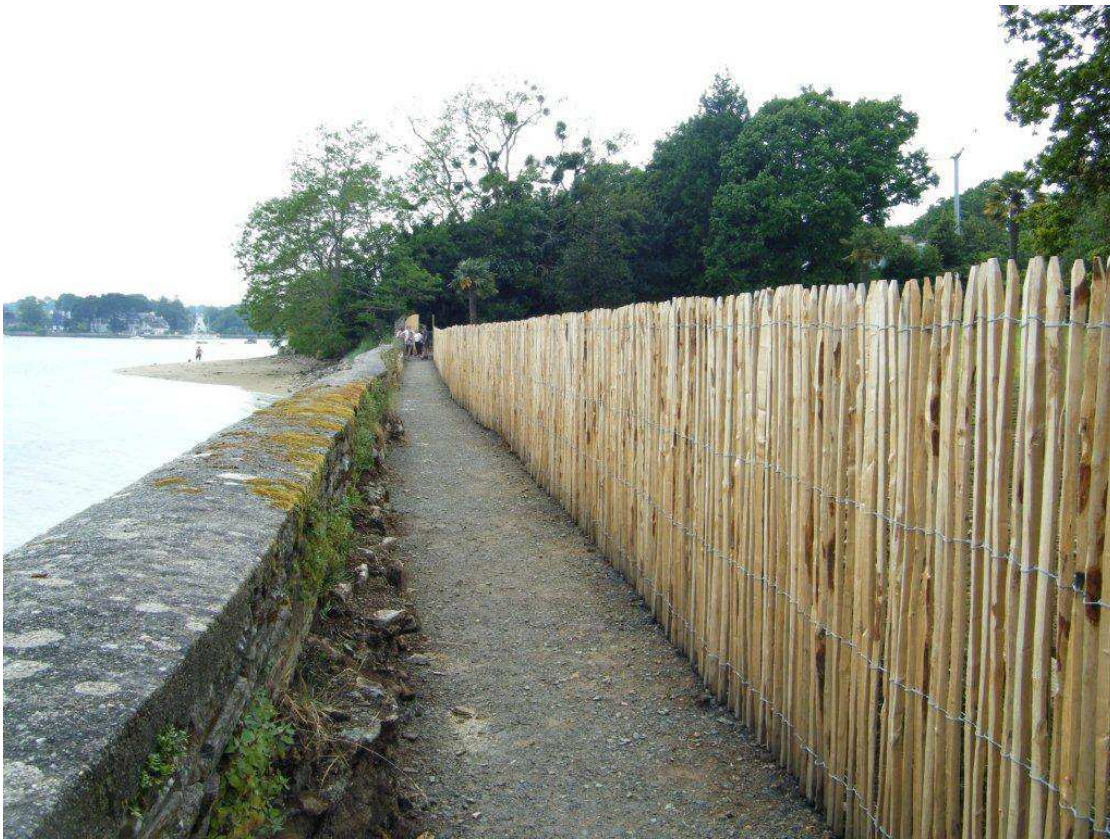
Photo 04 : Servitude piétonne à La Forêt-Fouesnant : Ici, l'ASPF a obtenu « à l'amiable » avec un riverain coopératif, un aménagement léger, esthétique et peu coûteux.