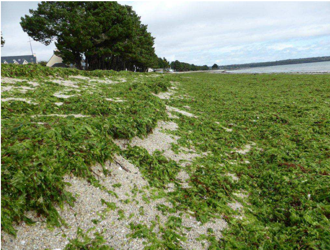
Photo 14 : algues vertes à Cap Coz le 20 10 2013.

Mais heureusement grâce à une météo peu clémente (manque d'ensoleillement, eaux froides avant l'été), elles n'ont pu proliférer. Mais peut-on se réjouir alors que 6000 tonnes d'algues vertes ont encore été ramassées sur nos plages, 6 millions d'euros dépensés pour les sécher et que le volet préventif est au point mort ?